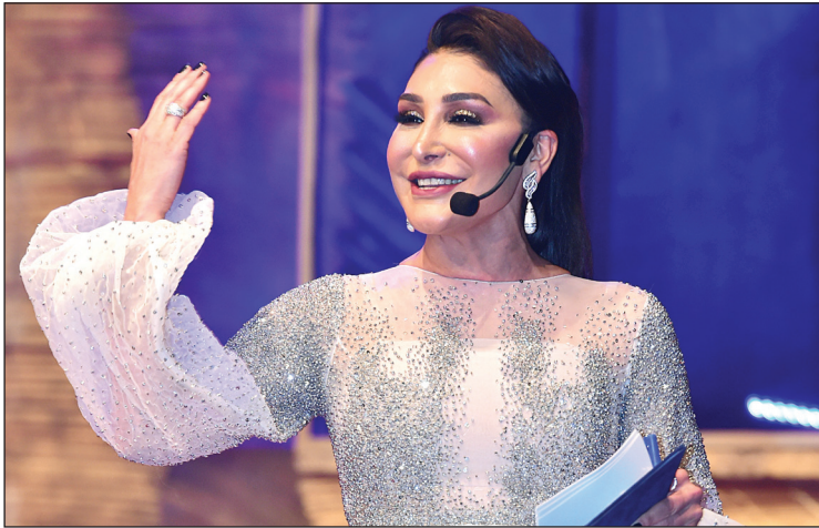
عريفة حفل الختام الفنانة أحلام حسن