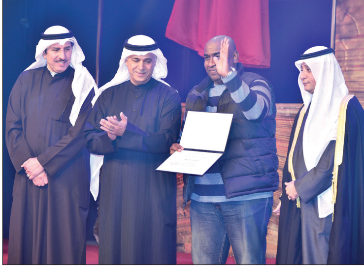
تكريم الفرق المشاركة