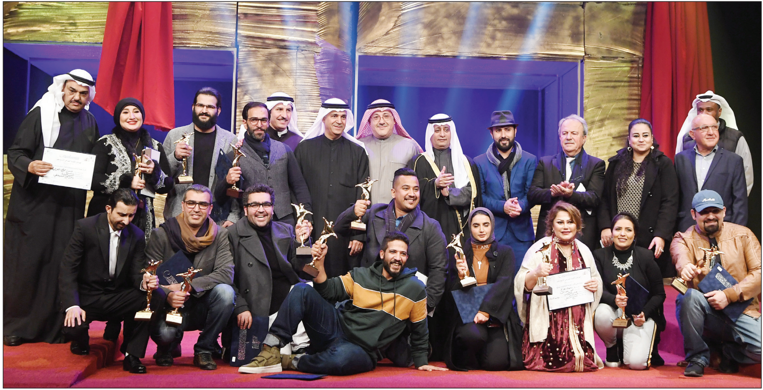
الفائزون بالجوائز مع المسؤولين عن المهرجان ولجنة التحكيم في لحظة تذكارية