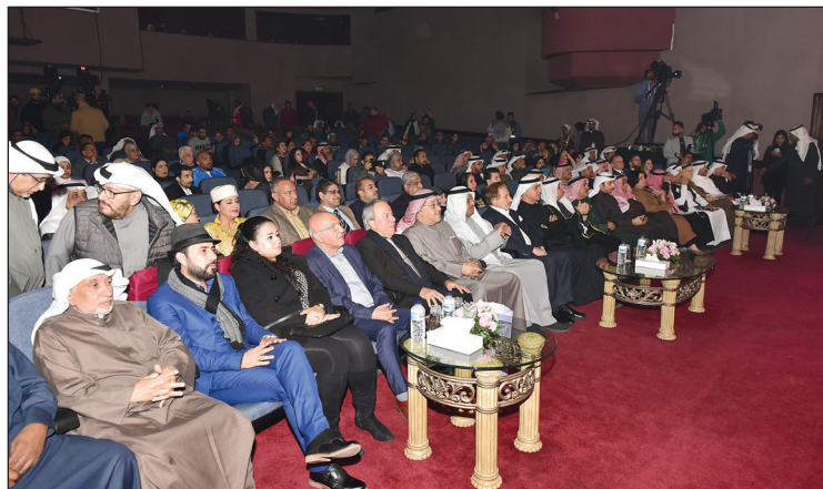
الأمين العام للمجلس الوطني للثقافة والفنون والآداب المهندس علي اليوحة وكبار المسرحيين وضيوف المهرجان في مقدمة الحضور