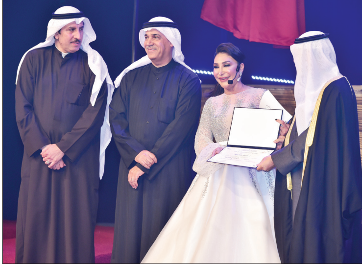
تكريم الفنانة أحلام حسن