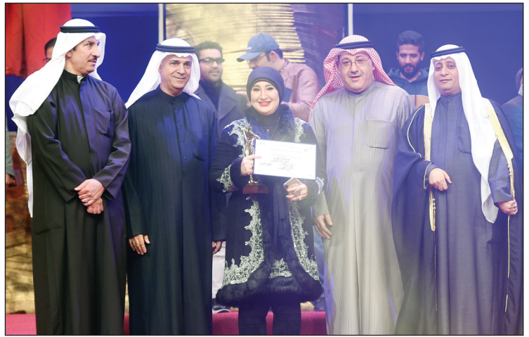
الفنانة سماح تتسلم جائزة أفضل ممثلة دور أول