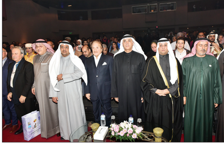
عزف السلام الوطني