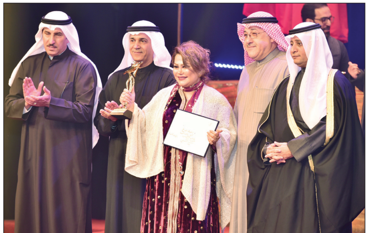
الفنانة فاطمة الطباخ تتسلم جائزة أحسن ممثلة دور ثان