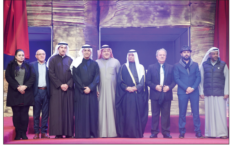
لجنة تحكيم المهرجان في لقطة تذكارية