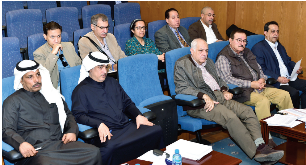
جانب من الحضور في المؤتمر الصحفي